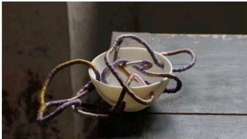
Michela Cavagna, The impossible tea party