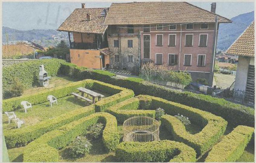
Il giardino all'italiana di Casa Regis, a Valdiliana